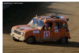
Départ de l'édition 2023 – Sati Sotrav, Team F4 et Carp's Team 4L sur le podium final