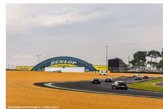
Ambiance Le Mans