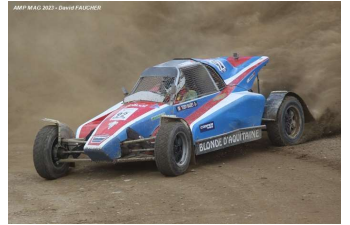
Teddy Baudet (Super Buggy)

Teddy Baudet (Aquitaine Nord) s'impose devant Erwan Le Pesquer* et devant Christophe Guegan*... etc