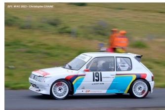
Gilbert Payneau (F2000.3)

7 – Yann FARDEAU Fiat Bertone X1/9 # 402 / OP / Second / OP.1 : Vainqueur