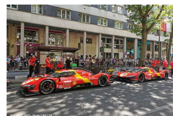
Ambiance Pesage précédant la journée test