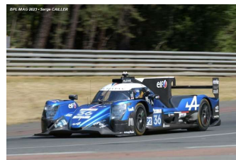
4 – Vaxiviere / Milesi / Canal Oreca 07-Gibson # 36 Alpine Team Elf 327 tours