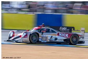
13 – H-Hanson / Rasmussen / Fittipaldi Oreca 07-Gibson # 28 JOTA 316 tours