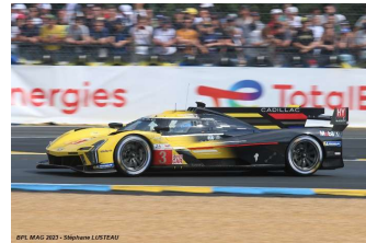
4 – Bourdais / Van Der Zande / Dixon Cadillac V-SR # 3 Cadillac Racing 340 tours