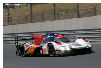
Ab – Nasr / Jaminet / Tandy Porsche 963 # 75 Porsche Penske Msport 84 tours