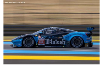
8 – Hull / Haryanto / Segal Ferrari 488 GT3 Evo # 100 Walkenhorst Motorsport 307 tours