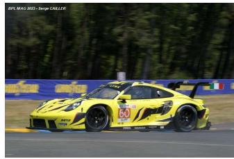
Ab – Cressoni / Schiavoni / Picariello Porsche 911 RSR-19 # 60 Iron Lynx 28 tours