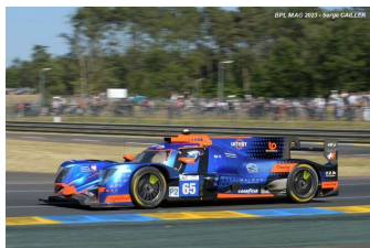
14 – Maldonado / V. Der Helm / V. Uiterl Oreca 07-Gibson # 65 Panis Racing 316 tours