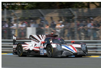
Ab – Perrodo / Barnicoat / Nato Oreca 07-Gibson # 80 (Pro-Am) AF Corse 183 tours