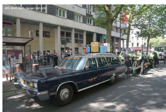
Ambiance Pesage précédant la journée Test