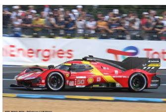
5 – Fuoco / Molina / Nielsen Ferrari 499 P # 50 Ferrari AF Corse 337 tours