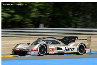
13 – Da Costa / Stevens / Ye Porsche 935 # 38 Hertz Team Jota 244 tours