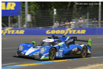
17 – Lacorte / Van Der Garde / Pilet Oreca 07-Gibson # 39 (Pro-Am) Graff Racing 303 tours