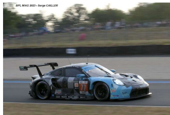
14 – Ried / Pedersen / Andlauer Porsche 911 RSR-19 # 77 Dempsey-Proton 118 tours