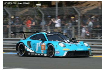
Ab – Hardwick / Robichon / Heylen Porsche 911 RSR-19 # 16 Iron Lynx 28 tours