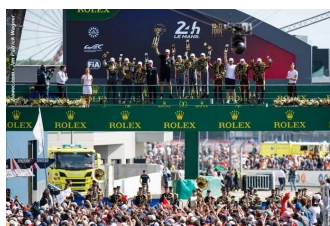
Algarve Pro Racing # 45 Cool Racing # 37 DKR Engineering # 43