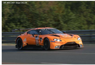
2 – Al Harthy / Dinan / Eastwood Aston Martin Vantage AMR # 25 ORT by TF 312 tours