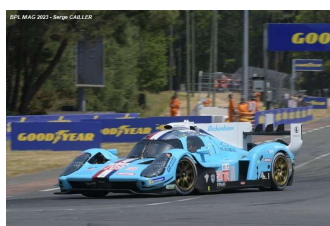
7 – Mailleux / Berthon / Gutierrez Glickenhaus 007 # 709 Glickenhaus Racing 333 tours