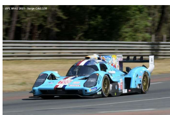
6 – Dumas / Briscoe / Pla Glickenhaus 007 # 708 Glickenhaus Racing 335 tours