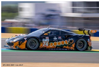
9 – Cozzolino / Tsuchioka / Yokomizo Ferrari 488 GTE Evo # 74 Kessel Racing 303 tours