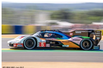
9 – Cameron / Christensen / Mako Porsche 963 # 5 Porsche Penske Msport 325 tours