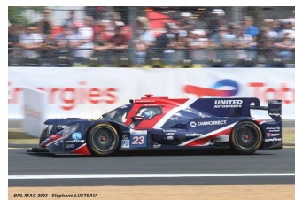
8 – Pierson / Blomqvist / Jarvis Oreca 07-Gibson # 23 United Autosports 323 tours