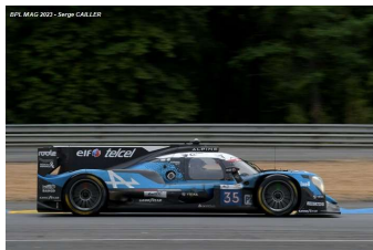
9 – Negrao / Caldwell / Rojas Oreca 07-Gibson # 35 Alpine Elf Team 322 tours