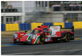
Ab – Pin / Kvyat / Bortolotti Oreca 07-Gibson # 63 Prema Racing 118 tours