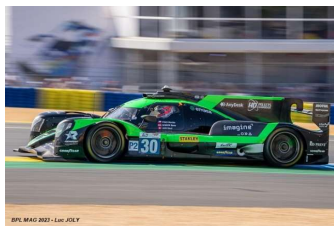
3 – Jani / Binder / Pino Oreca 07-Gibson # 30 Team Duqueine 327 tours