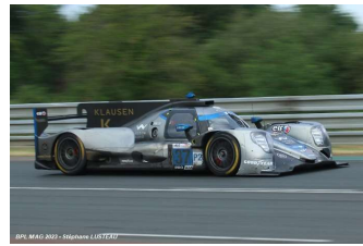
12 – Lapiere / Coigny / Jakobsen Oreca 07-Gibson # 37 (Pro-Am) Cool Racing 317 tours