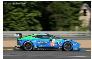
Ab – A. Robin / M. Robin / Hasse-Clot Aston Martin Vantage AMR # 72 TF Sport 58 tours