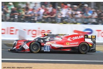
2 – Andrade / Deletraz / Kubica Oreca 07-Gibson # 41 Team WRT 328 tours