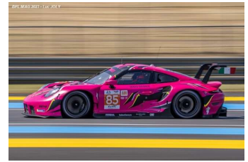
4 – Bovy / Frey / Gatting Porsche 911 RSR-19 # 85 Iron Dames 312 tours