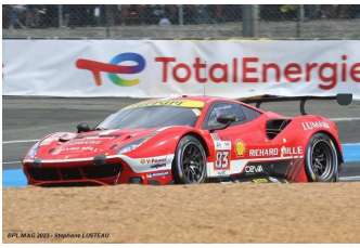
Ab – P. Compagnon / Rovera / Wadoux Ferrari 488 GTE Evo # 83 Richard Mille AF Corse 33 tours