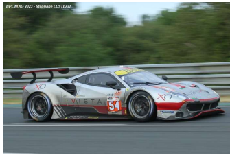
5 – Flohr / Castellacci / Rigon Ferrari 488 GTE Evo # 54 AF Corse 312 tours