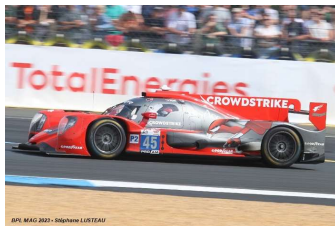
10 – Kurtz / Allen / Braun Oreca 07-Gibson # 45 (Pro-Am) Algarve Pro Racing 322 tours