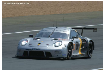
Ab – Fassbinder / Rump / Lietz Porsche 911 GT3 RSR-19 # 911 Proton Competition 246 tours