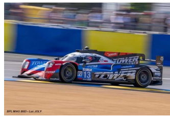
Ab – Thomas / R. Taylor / Rast Oreca 07-Gibson # 13 (Pro-Am) Tower Motorsports 19 tours