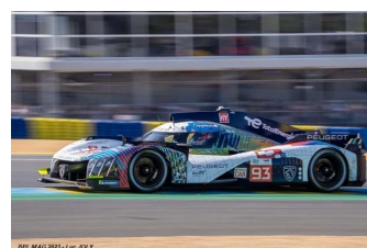
8 – Di Resta / Jensen / Vergne Peugeot 9X8 # 93 Peugeot TotalEnergies 330 tours