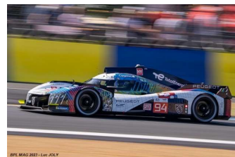
12 – Duval / Menezes / Müller Peugeot 9X8 # 94 Peugeot TotalEnergies 312 tours