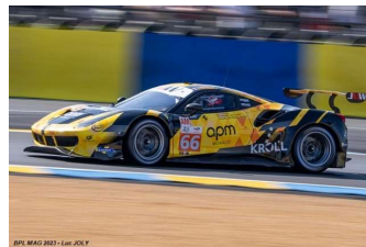
Ab – Neubauer / Prette / Patrobelli Ferrari 488 GTE Evo # 66 JMW Motorsport 89 tours