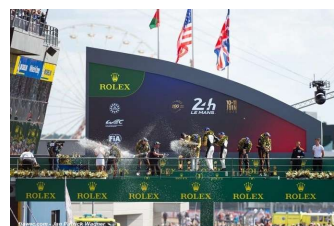
Corvette Racing # 33 ORT by TF # 25 GR Racing # 86