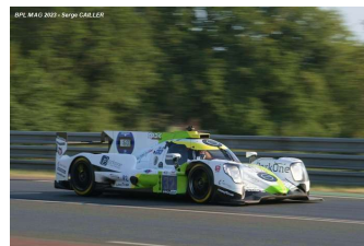
Ab – Kvamme / Magnussen / Fjordbach Oreca 07-Gibson # 32 Inter Europol Competition 117 tours