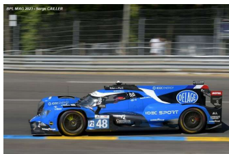
6 – Lafargue / Chatin / Hörr Oreca 07-Gibson # 48 IDEC Sport 327 tours