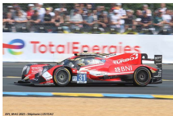
5 – H-Lothringen / Gelael / Frijns Oreca 07-Gibson # 31 Team WRT 327 tours