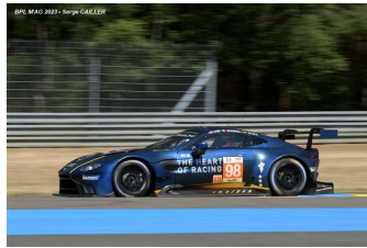
6 – James / Mancinelli / Riberas Aston Martin Vantage AMR # 98 Northwest AMR 310 tours