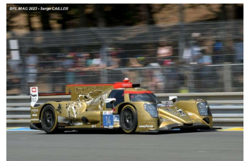
Ab – Sales / Beche / Hanley Oreca 07-Gibson # 14 (Pro-Am) Nielsen Racing 18 tours