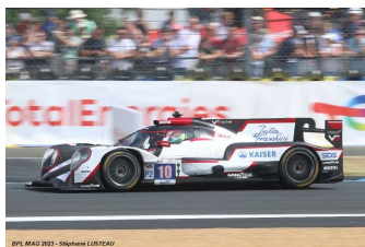
7 – Aubry / Kaiser / Cullen Oreca 07-Gibson # 10 Vector Sport 325 tours