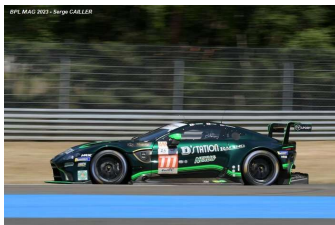
Ab – Hoshino / Fujii / Stevenson Aston Martin Vantage AMR # 777 D'Station Racing 163 tours