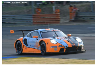
3 – Wainwright / Pera / Barker Porsche 911 RSR-19 # 86 GR Racing 312 tours