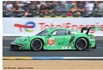
7 – Hyett / Jeannette / Cairol Porsche 911 RSR-19 # 56 Project 1 A-O 309 tours