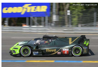
Ab – Dillman / Guerrieri / Vautier Vanwall Vandervell 680 # 4 Floyd Vanwall R. T. 165 tours