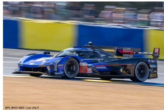
3 – Bamber / Westbrook / Lynn Cadillac V-SR # 2 Cadillac Racing 341 tours