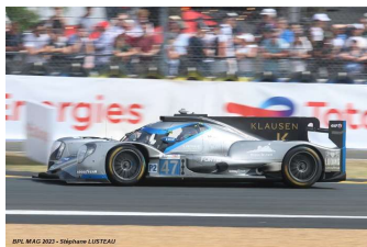
Ab – De Gerus / Lomko / Pagenaud Oreca 07-Gibson # 47 Cool Racing 158 tours