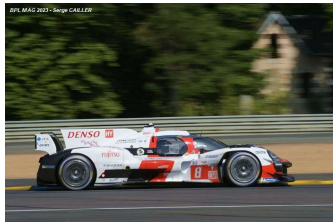
2 – Hirakawa / Buemi / Hartley Toyota GR010 Hybrid # 8 Toyota Gazoo Racing 342 tours