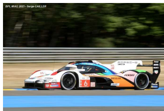
11 – Estre / Lotterer / L. Vanthoor Porsche 963 # 6 Porsche Penske Msport 320 tours