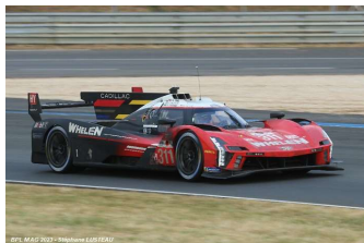
10 – Derani / Sims / Aitken Cadillac V-SR # 311 Action Express Racing 324 tours