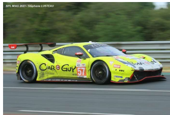
Ab – Kimura / Huffaker / Serra Ferrari 488 GTE Evo # 57 Kessel Racing 254 tours