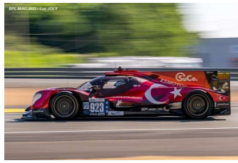
Ab – Yoluc / Gamble / D. Vanthoor Oreca 07-Gibson # 923 (Pro-Am) Racing Team Turkey 87 tours