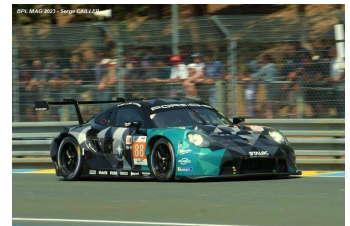
Ab – Tincknell / Yount / Ried Porsche 911 RSR-19 # 88 Proton Competition 170 tours