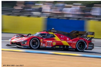
1 – Pier Guidi / Calado / Giovinazzi Ferrari 499 P # 51 Ferrari AF Corse 342 tours

La catégorie n'aura connu que 3 abandons sur les 16 voitures au départ.