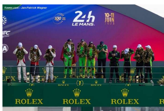
Inter Europol Competition # 34 Team WRT # 41 Team Duqueine # 30