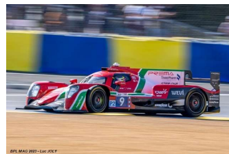
16 – Viscaal / Correa / Ugran Oreca 07-Gibson # 9 Prema Racing 310 tours