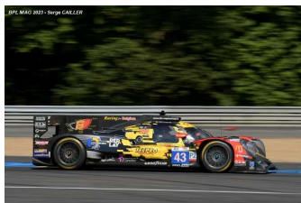
15 – Van Rompuy / De Wilde / Martin Oreca 07-Gibson # 43 (Pro-Am) DKR Engineering 311 tours