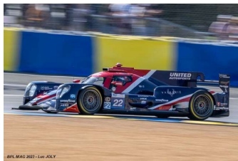
11 – Hanson / Albuquerque / Lubin Oreca 07-Gibson # 22 United Autosports 321 tours