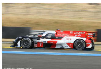
Ab – Kobayashi / Conway / López Toyota GR010 Hybrid # 7 Toyota Gazoo Racing 103 tours