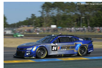
Ferrari AF Corse (Hypercar), JOTA (LMP2) et JMW Motorsport (GTE-Am) // Impressionnante, la Chevrolet Camaro issue de la Nascar Au top de la journée test des 24 Heures du Mans 2023