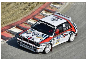
Rallye 4WD Lancia Delta Integrale 16V