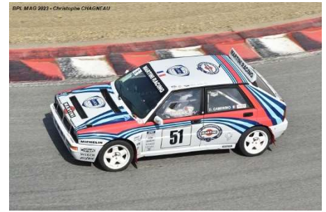
Rallycross 4WD : Peugeot 205 T16 Evo2 – Citroën BX 1900 Turbo 4x4 – Lancia Delta Integrale 16V