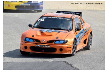
Rallycross 4WD : Ford RS200 Evo1 – Audi Quattro S1 E2 – BMW 318 Ti T3F – Renault Mégane T3F V6 PR