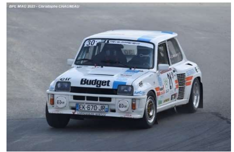
Rallycross 4WD : Citroën AX Turbo 4x4 /// Rallycross 2WD : Alpine A310 Politecnic 1600 – Renault 5 Turbo