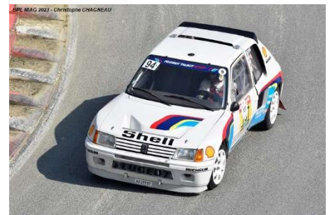
Rallye 4WD : MG Metro 6R4 – Audi Quattro Sport – Peugeot 205 T16 Evo 1