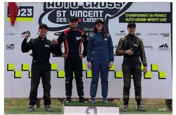
Podiums Sprint Girls, Maxi Tourisme, Buggy Cup et Junior Sprint

Source : ffsa.org et its-results.com – Photos : OFAC (Page facebook)