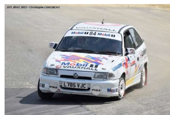
Rallye 2WD Vauxhall Astra Vsi Mk3