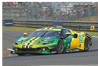
8 – Toledo / Wadoux / Agostini Ferrari 296 GT3 # 150 Richard Mille AF Corse 334 tours