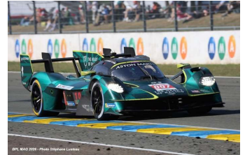
8 – Tincknell / Gamble / Gunn Aston Martin Valkyrie # 007 Aston Martin Thor Team 379 tours