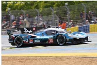
10 – Makowiecki / Gounon / Martins Alpine A424 # 36 Alpine Endurance Team 379 tours