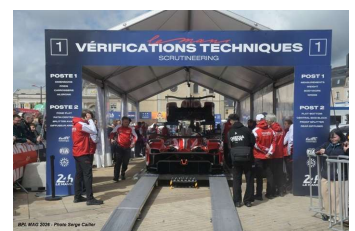
Ambiance Pesage précédant la journée test