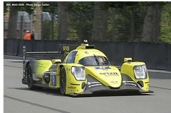
11 – Ried / Ohta / King Oreca 07-Gibson # 9 Proton Competition 356 tours