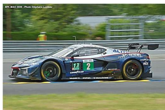
14 – Ibrahim / Hanafin / Green Corvette Z06 GT3.R # 2 TF Sport 330 tours