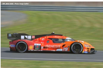
13 – Jaminet / Chatin / Juncadella Genesis GMR-001-H # 19 Genesis Magma Racing 372 tours