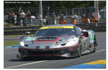
Aston Martin Thor Team, IDEC Sport (LMP2), TDS Racing (LMP2 ProAm) et Vista AF Corse (GT3) Au top de la journée test des 24 Heures du Mans 2026