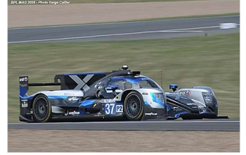
5 – Closmenil / Aguilera / Jensen Oreca 07-Gibson # 37 CLX Motorsport 360 tours