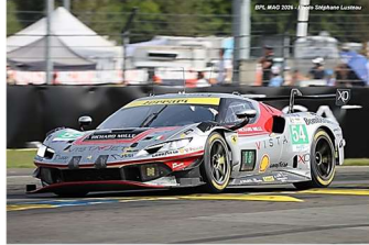
AB – Flohr / Castellacci / Rigon Ferrari 296 GT3 Evo # 54 Vista AF Corse 110 tours