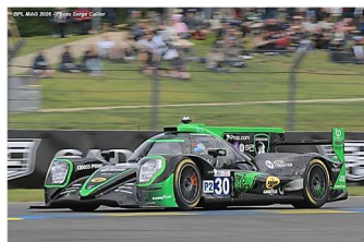
AB : Pin / Andlauer / Verschoor Oreca 07-Gibson # 30 Duqueine Team 307 tours