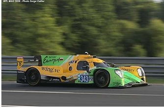
2 – Garg / De Gérus / Müller Oreca 07-Gibson # 343 Inter Europol Competition 360 tours