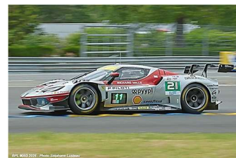
5 – Hériau / Mann / Rovera Ferrari 296 GT3 Evo # 21 Vista AF Corse 335 tours