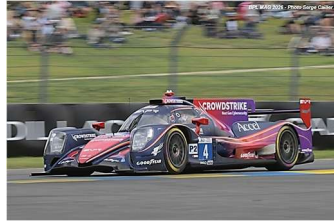
7 – Kurtz / Quinn / Heinrich Oreca 07-Gibson # 4 (ProAm) Crowstrike Racing by APR 358 tours