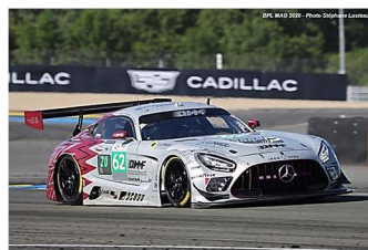
16 – Al-Khelaifi / Hanses / Alesi Mercedes-AMG GT3 # 62 Team Qatar by Iron Lynx 324 tours