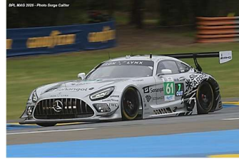
AB – Berry / Andrade / Martin Mercedes-AMG GT3 # 61 Iron Lynx 65 tours