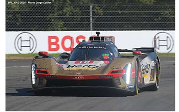
4 – Deletraz / Stevens / Nato Cadillac V-Series R # 12 Cadillac Hertz Team Jota 381 tours