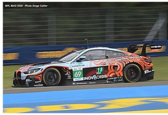
AB – McIntosh / Thompson / Harper BMW M4 GT3 Evo # 69 Team WRT 291 tours