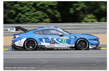
AB – Powell / Tuck / S. Priaux Ford Mustang GT3 # 77 Proton Competition 244 tours