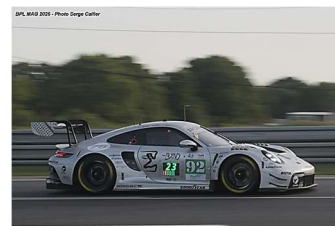
13 – Shahin / Pera / Lietz Porsche 911 GT3.R # 92 The Bend Manthey 330 tours