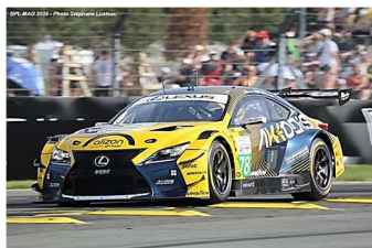
2 – Van Rompuy / David / Hawsworth Lexus RC F GT3 # 78 Akkodis-ASP 335 tours