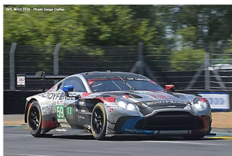
11 – Mateu / Fossard / Hasse Clot Aston Martin Vantage AMR GT3 # 59 Racing Spirit of Léman 332 tours