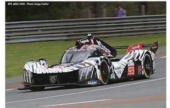
12 – Di Resta / Vandoorne / Cassidy Peugeot 9X8 # 93 Peugeot Total Energies 376 tours