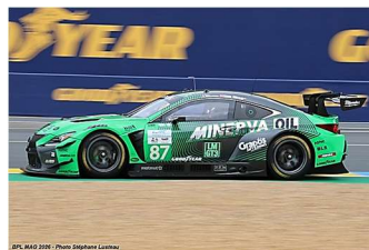
4 – Umbrurescu / Schmid / Lopez Lexus RC F GT3 # 87 Akkodis-ASP 335 tours