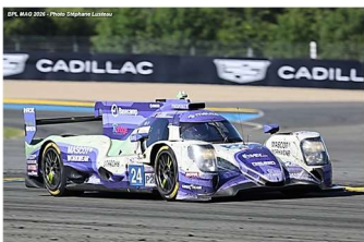
18 – H-Hanson / Pearson / Doohan Oreca 07-Gibson # 24 Nielsen Racing 340 tours