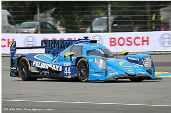
14 – Fluxà / Felbermayr / F. Felbermayr Oreca 07-Gibson # 44 (ProAm) Proton Competition 354 tours