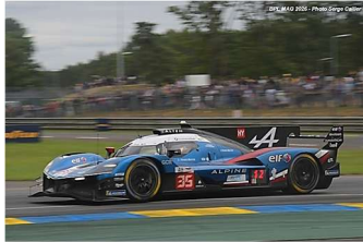
6 – Felix Da Costa / Milesi / Habsburg Alpine A424 # 35 Alpine Endurance Team 381 tours