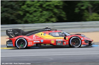
5 – Pier Guidi / Calado / Giovinazzi Ferrari 499P # 51 Ferrari AF Corse 381 tours