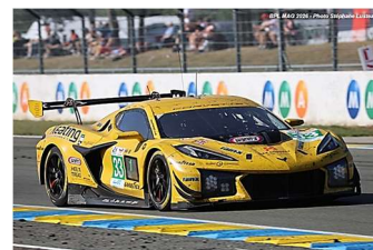
1 – Keating / Edgar / Catsburg Corvette Z06 GT3.R # 33 TF Sport 336 tours

Généralement fiable, la catégorie a connu un déchet important avec huit abandons.