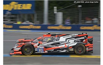
9 – Perrodo / Vaxiviere / Barnicoat Oreca 07-Gibson # 183 (ProAm) AF Corse 357 tours