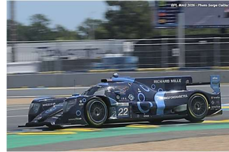
8 – Lindh / Saucy / Jensen Oreca 07-Gibson # 22 United Autosports 358 tours