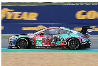
7 – Leung / Gelael / Farfus BMW M4 GT3 Evo # 32 Team WRT 334 tours