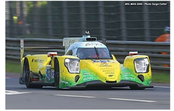
1 – Smiechowski / Dillmann / Yelloly Oreca 07-Gibson # 43 Inter Europol Competition 361 tours

À noter que tout comme en 2025, Tom Dillmann est l'unique pilote Français à monter sur la plus haute marche d'un podium.