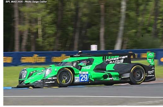
3 – Roussel / Masson / Gray Oreca 07-Gibson # 29 Forestier Racing by Panis 360 tours