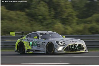
AB – Zelger / Cressoni / Hodenius Mercedes-AMG GT3 # 79 Iron Lynx 153 tours