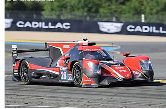
4 – Cullen / V. Lomko / P. Fittipaldi Oreca 07-Gibson # 26 Vector Sport 360 tours