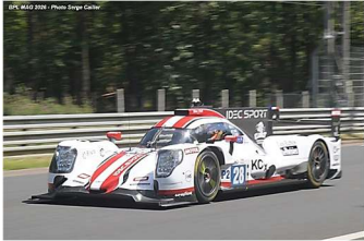
6 – Lafargue / Rinicella / Van Huitert Oreca 07-Gibson # 28 IDEC Sport 359 tours