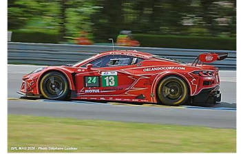
AB – Fidani / Kern / M. Bell Corvette Z06 GT3.R # 13 13 Autosport 61 tours