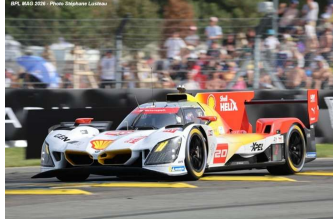
2 – Frijns / Rast / S. Van Der Linde BMW M Hybrid V8 # 20 BMW M Team WRT 381 tours