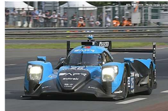
12 – Jensen / Trulli / Hughes Oreca 07-Gibson # 25 (ProAm) Algarve Pro Racing 356 tours