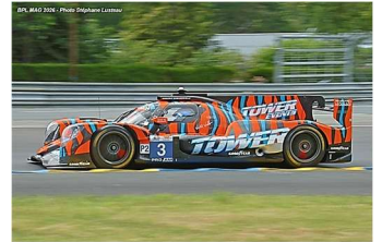
17 – Farano / Alvarez / Van Der Zande Oreca 07-Gibson # 3 (ProAm) DKR Engineering 344 tours