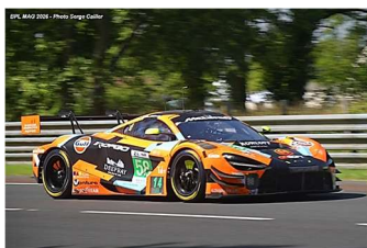
15 – West / Gehrsitz / Goethe McLaren 720S GT3 Evo # 58 Garage 59 329 tours