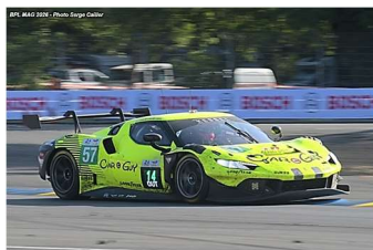
10 – Kimura / Laursen / Serra Ferrari 296 GT3 # 57 Kessel Racing 334 tours