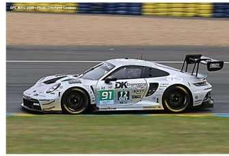
AB – Gottingham / Boguslavskiy / Güven Porsche 911 GT3.R # 91 Manthey DK Engineering 254 tours