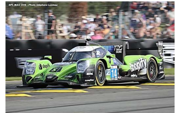
13 – Lundke / Beche / Estre Oreca 07-Gibson # 14 (ProAm) TDS Racing 355 tours