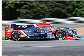
15 – Schneider / Hanley / Jarvis Oreca 07-Gibson # 222 (ProAm) United Autosports 354 tours