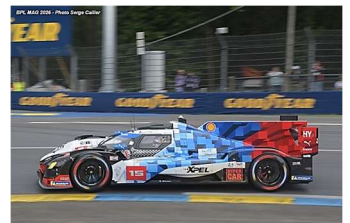
AB – Magnussen / Marciello / D. Vanthoor BMW M Hybrid V8 # 15 BMW M Team WRT 272 tours