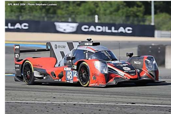
16 – Poordad / Vautier / Dumas Oreca 07-Gibson # 48 (ProAm) RD Limited 353 tours