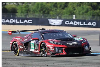
6 – Dempsey / Yoluc / Eastwood Corvette Z06 GT3.R # 34 Racing Team Turkey by TF 335 tours