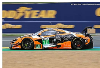
12 – Au / Fleming / Kirchhöfer McLaren 720S GT3 Evo # 10 Garage 59 332 tours