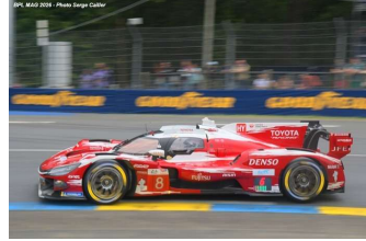
3 – Buemi / Hartley / Hirakawa Toyota TR010-H # 8 Toyota Racing 381 tours