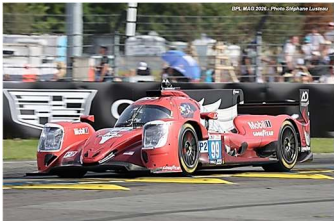
10 – Hyett / Allen / Cameron Oreca 07-Gibson # 99 (ProAm) AO by TF 356 tours