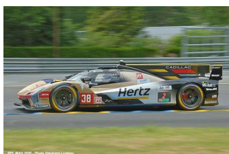
Ab – Bourdais / Bamber / Aitken Cadillac V-Series R # 38 Cadillac Hertz Team Jota 218 tours