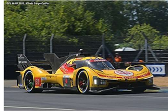
7 – Ye / Kubica / Hanson Ferrari 499P # 83 AF Corse 381 tours