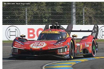
AB – Fuoco / Nielsen / Molina Ferrari 499P # 50 Ferrari AF Corse 284 tours