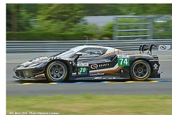
9 – Blattner / Patrese / Marschall Ferrari 296 GT3 # 74 Kessel Racing 334 tours