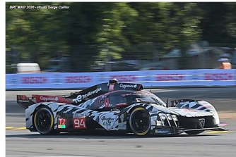
11 – Duval / Jakobsen / Pourchaire Peugeot 9X8 # 94 Peugeot Total Energies 377 tours