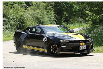
Porsche 911 2.7 1975, Lancia Fulvia Coupé 1300 S 1976, Talbot Samba Rallye Gr.B 1984 et une des plus récentes, la Chevrolet Camaro de 2020