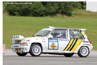
Du drift pour chauffer le public – Du sport à la française (R8 Gordini, Alpine A110, Renault 5 GT Turbo)

Bretagne Classic Automobile (Sixième édition) organisé par l'A.S.A. Océane avec le concours du Rallye Bretagne Organisation est une démonstration avec comme seul objectif la notion de plaisir sans prise de risques inutiles, le but étant de rouler à sa main en toute sécurité sur une route fermée. Une ou deux personnes à bord étaient autorisées.