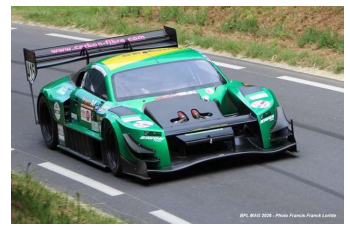
GB-HILLCLIMB MASTERS Simon Brainbridge

Top chrono Sport pour Simon Brainbridge (Sbracing Chrono # 415) en 1'28"510 (Meilleure montée). Top chrono Berlines pour Damien Bradley (Subaru Legacy # 471) en 1'30"576 (Meilleure montée).