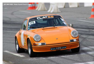
Sportives étrangères (Caterham SS, NSU TT 1200, Opel Manta et Porsche 911 T)