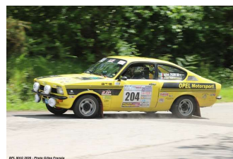
Ju. Pilon / Ja. Pilon