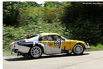
La plus ancienne, l'Austin Seven de 1932, Dauphine proto 1970, Marcos GT 2.0 1971 et Alpine A 110 1971

Organisée par l'A.S.A.C.O. Bretagne avec le concours de l'Écurie Cote d'Amour, cette manifestation dénommée 5 ème Montée Historique de la Baule empruntait le tracé du chemin des 4 saisons, route de La Grée Guillaume à la route du bois Chevallier à la Baule sur 2 km (commune de Guérande, à côté du château d'eau).