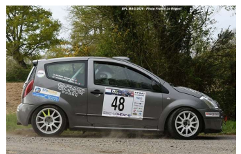
K. Toussain / E. Serre