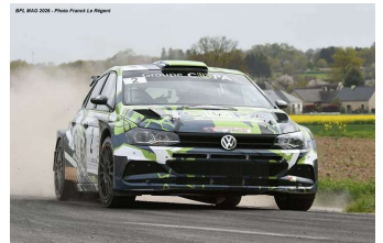
B. Longépé / L. Besson