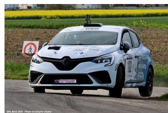
T. Landais / M. Lefebvre