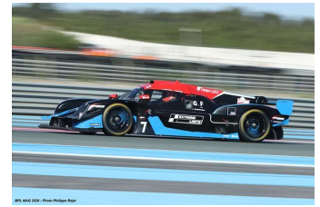
Nova Extrême Limite