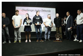
Rallye Trophée Jacky Deborde