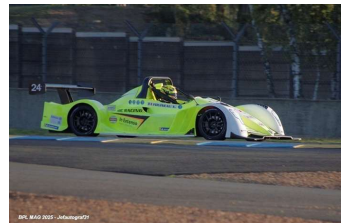
Funyo : Xavier Fouineau