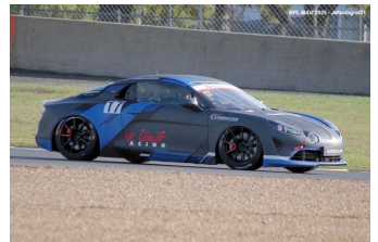
GTTS : Guillaume Charpentier