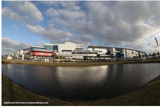
Daytona international Speedway