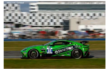
GS : Aston Archangel Msports