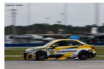
TCR : Audi JDC-Miller Msports

PROCHAIN RENDEZ-VOUS : ALAN JAY 120 at SEBRING du 13 au 16 mars.