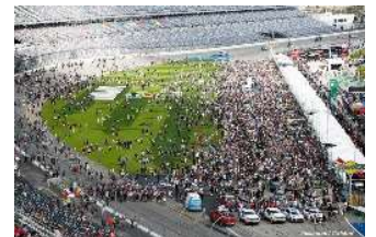
Nombreux public au départ de cette édition 2024