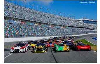
Un plateau de 59 voitures (23 Prototypes et 36 GT)

Premier rendez-vous du Championnat d'Endurance Nord-Américain et de la Michelin Endurance Cup, les 24 Heures de Daytona accueillait cette année un plateau de 59 voitures. Sur ces 59 concurrents, 23 Prototypes (28 en 2023) et 36 GT (33 en 2023). Du côté des prototypes, 10 GTP (Acura, BMW, Cadillac et Porsche) et 10 LMP2 (Oreca et Ligier). En GTD-Pro, 13 voitures (Aston Martin, BMW, Chevrolet, Ferrari, Ford, Lamborghini, Lexus, McLaren, Mercedes-AMG et Porsche). En GTD, 23 voitures (Acura, Aston Martin, BMW, Chevrolet, Ferrari, Ford, Lamborghini, Lexus, McLaren, Mercedes-AMG et Porsche).