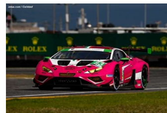
Porsche JDC-Miller Msports (GTP) – Acura Wayne Taylor (GTP) – Ford Multimatic Msports (GTD-Pro) – Lamborghini Iron Dames (GTD)