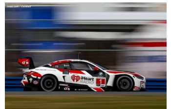
GT : Course à oublier côtés Ford et Chevrolet – AO Racing et Paul Miller Racing complètent le podium GTD-Pro

52 changements de leaders concernant 8 voitures.