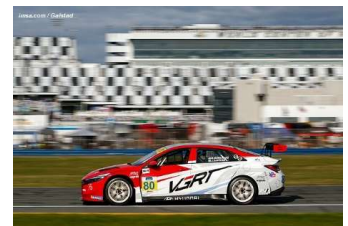
TCR : Hyundai VGRT