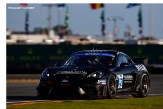
GS : Porsche Kellymoss-Riley

Engagés : 45 – Partants : 44 – Classés : 44 dont 31 en piste à l'arrivée.