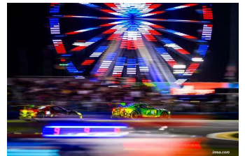
La longue nuit des 24 Heures