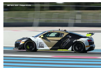
Bac / Cabirou (Silver) – Rambaud (Am) – G. Simon / P. Huteau (ProAm) – Castelli / Wallgren (ProAm)