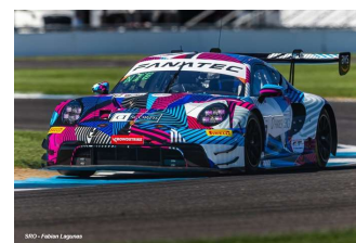
Start race – Action – Top 5 pour le DXDT Racing (Chevrolet) – Top 6 pour RS1 – Herberth Motorsport, pole et succès en Pro-Am