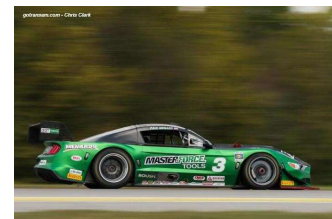
Paul Menard (TA)

Engagés : 30 – Partants : 30 – Classés : 30 dont 22 en piste à l'arrivée.