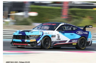
Tremoulet / Jouffret (ProAm) – Salomone / Servol (Am) – Verdier / Herrero (Silver) – Vanspringel / Verdonck (Silver)

ESSAIS LIBRES (Meilleurs chronos des séances libres).